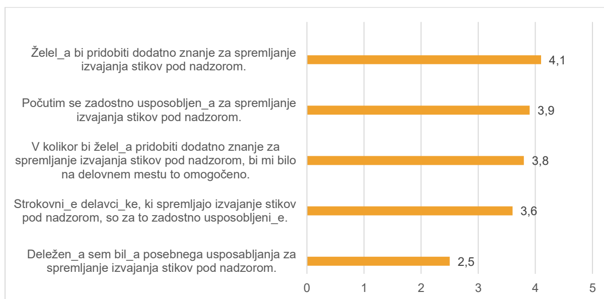
SLIKA 1: POVPREČNE VREDNOSTI STRINJANJA S TRDITVAMI O USPOSOBLJENOSTI ZA SPREMLJANJE IZVAJANJE STIKOV POD NADZOROM IN IZVAJANJE S TEM POVEZANIH NALOG (KJER 1 POMENI NAJSLABŠO OCENO, 5 PA NAJBOLJŠO)

Delež anketiranih 13 , ki ocenjujejo, da so bili deležni posebnega usposabljanja za spremljanje izvajanja stikov pod nadzorom, je zelo nizek (kar 55 % se sploh ne strinja. oz. ne strinja s to trditvijo). Po drugi strani pa je najvišji delež ravno pri želji po pridobivanju dodatnega znanja za to storitev (s to trditvijo se popolnoma strinja oz. strinja kar 61 % anketirancev). Ne glede na navedeno, se anketirani zaposleni na CSD počutijo razmeroma zadostno usposobljene za spremljanje izvajanja stikov pod nadzorom (s čimer se popolnoma strinja oz. strinja 65 %) – a vendar izpostavljajo, da je nujno sistematično in posebej usmerjeno usposabljanje.